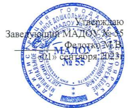
График работы специалистов муниципального автономного дошкольного образовательного учреждения «Детский сад № 55» на 2023-2024 учебный год