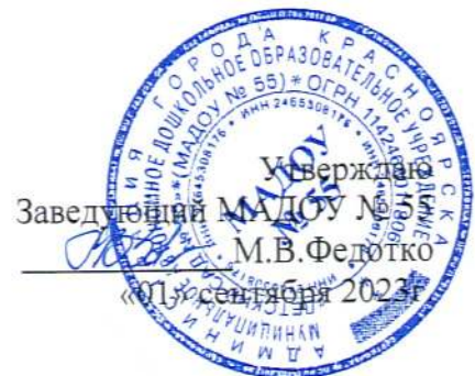
График получения пищи в муниципальном автономном дошкольном образовательном учреждении «Детский сад № 55» с 01.09.2023г. (холодный период)